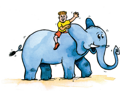
Elefant = Instrument

Um diese Inhalte für Kinder interessant zu gestalten und um einen Wiedererkennungseffekt zu bewirken, wurden den verschiedenen Bereichen Tierfiguren zugeordnet.